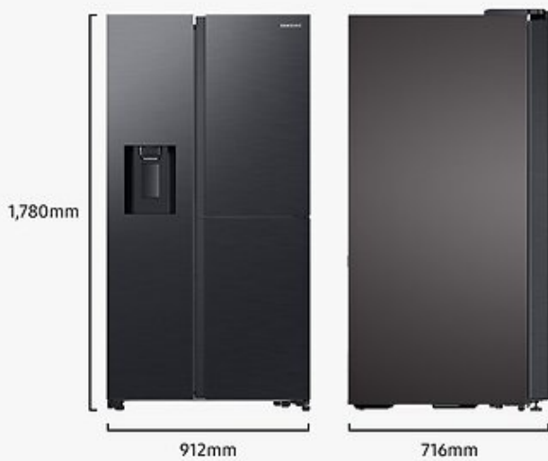
Abbildung dient nur zur Illustration der Abmessungen.